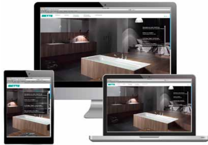
Optimiert auch für Tablet und Smartphone

Großformatige Bilder und eine übersichtliche Menüführung leiten den Besucher direkt und einfach durch die ganze Bette-Welt. Alle wichtigen Unterlagen zum Download sowie viele zusätzliche Services für die Zielgruppen Handel & Handwerk sowie Planer & Architekten liefern reichlich Mehrwert. Schauen Sie vorbei und lassen Sie sich inspirieren!